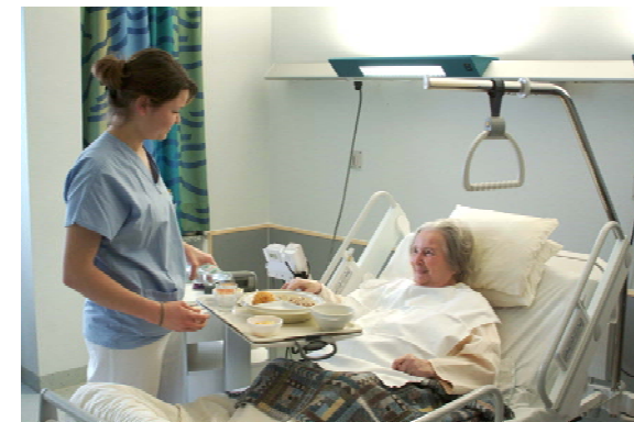
Akademie für Gesundheits- und Pflegeberufe

Dieser Kurs wird jährlich von der Akademie für Gesundheits- und Pflegeberufe angeboten. Beginn ist jeweils im September.